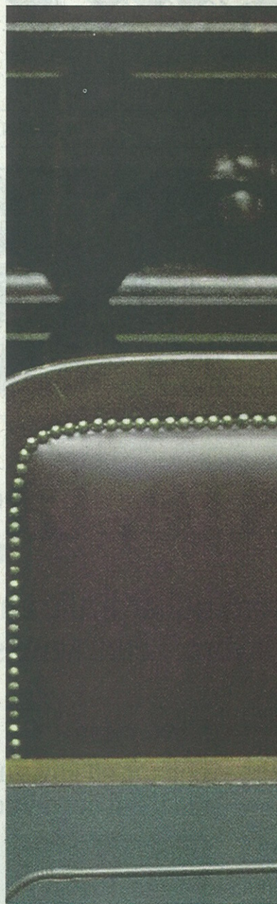
Il ministro dello Sviluppo, Flavio Zanonato

Il rifinanziamento del Fondo centrale di garanzia, ha spiegato il ministro dello Sviluppo Flavio Zanonato che si è battuto per inserire la norma nel decreto, «consentirà di attivare credito aggiuntivo per circa 50 miliardi». La Cassa depositi e Prestiti, inoltre, metterà a disposizione - come Il Messaggero ha anticipato ieri - 5 miliardi di credito agevolato per le imprese che innoveranno il processo produttivo con l'acquisto di